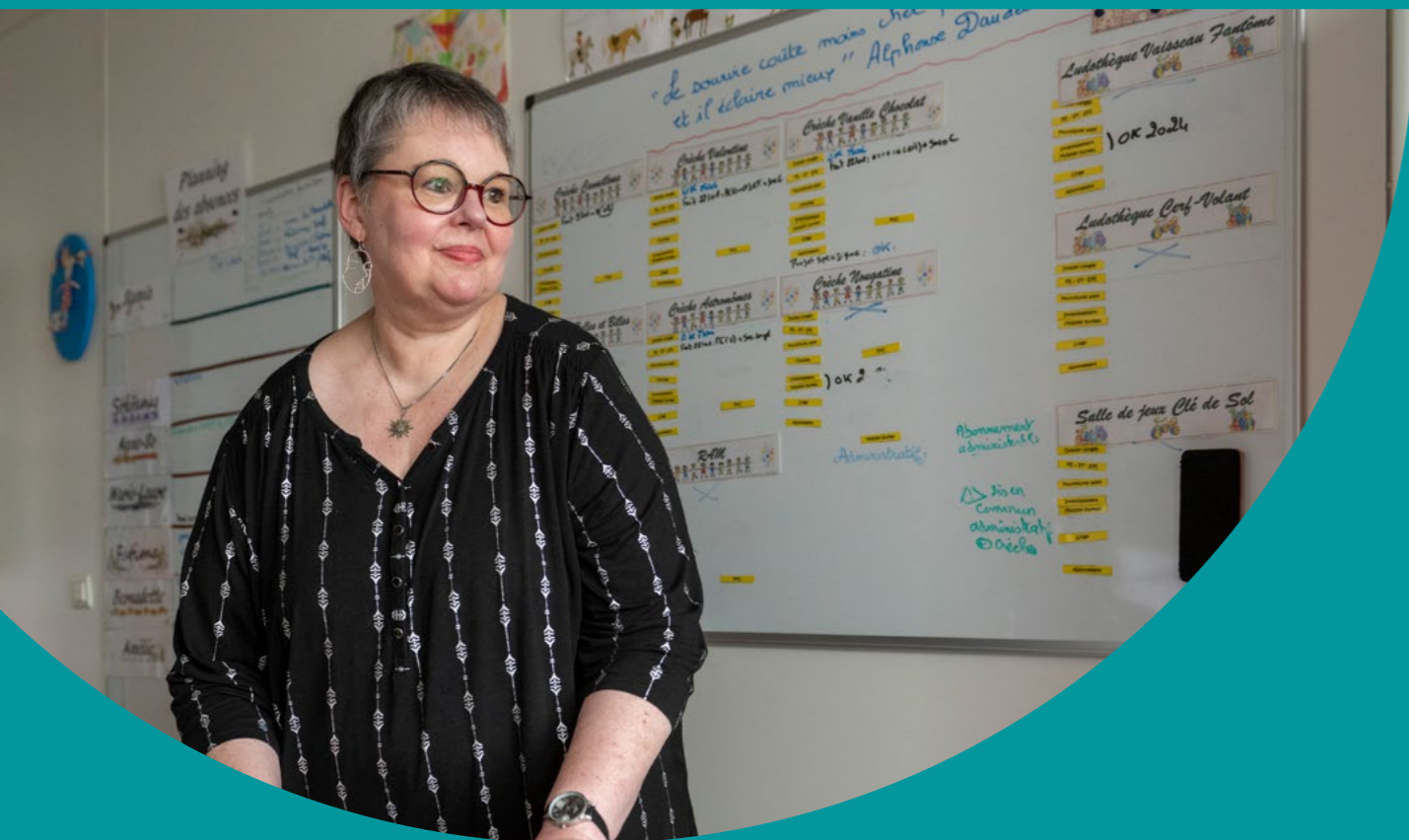
Photo de couverture : Najac